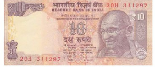
দশ টাকার নোট