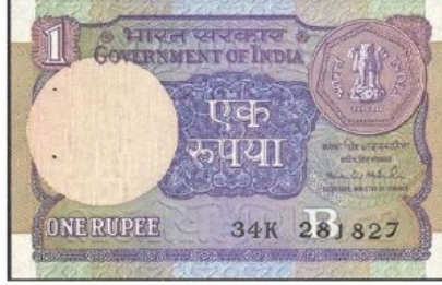
এক টাকার নোট