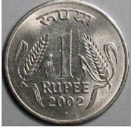
এক টাকার মুদ্রা